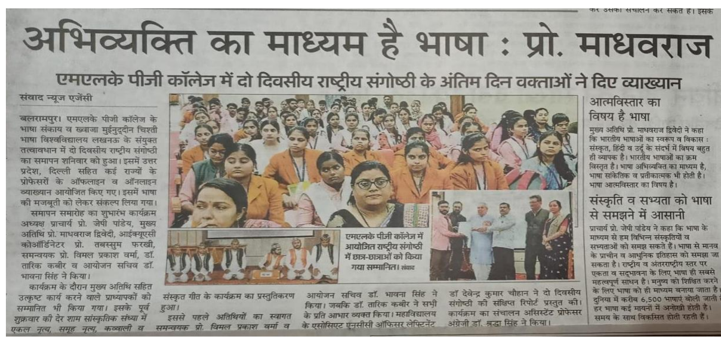
Date- 01/12/2024, Day - Sunday, Newspaper - Amar Ujala